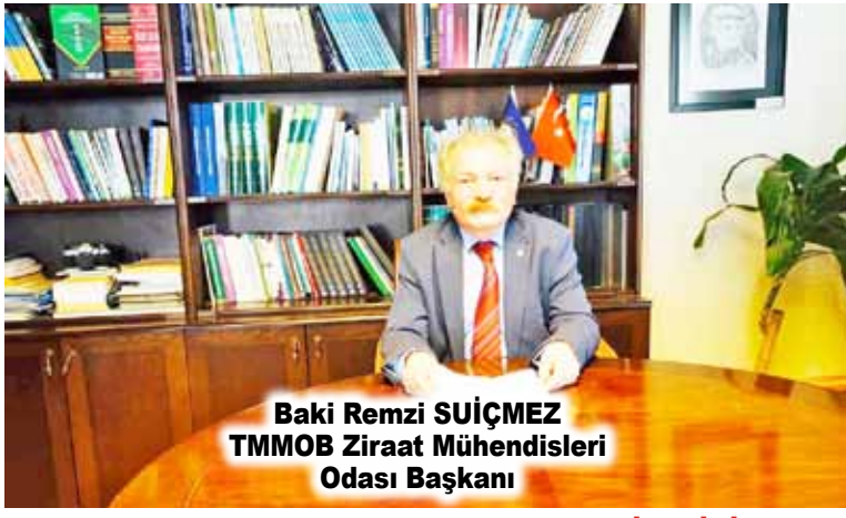
Baki Remzi SUIÇMEZ TMMOB Ziraat Mühendisleri Odası Başkanı