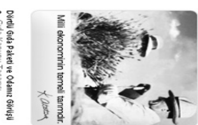
Millî ekonominin temelî tarımdır.

Sanı yılında, yerine yenilikçi sistemli sâdıklar, çareleri arayanak düzenlenmektedir. Demokrasinin arz olarak görünmektedir. Anayasal düzen haraj başkâlları ortamının yol çâllama düzenlenmektedir.