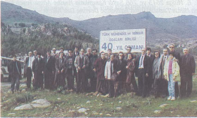
TMMOB 40. Yıl Ormanı Kuruluşuna Katılanlar ve İzmir Yönetim Kurulu Üyelerimiz

1994 yılında düzenlenen "Köy Enstitüleri ve Tarım" konulu panel kitap haline getirilip, ODA'nın yayınları arasına katılmıştır.