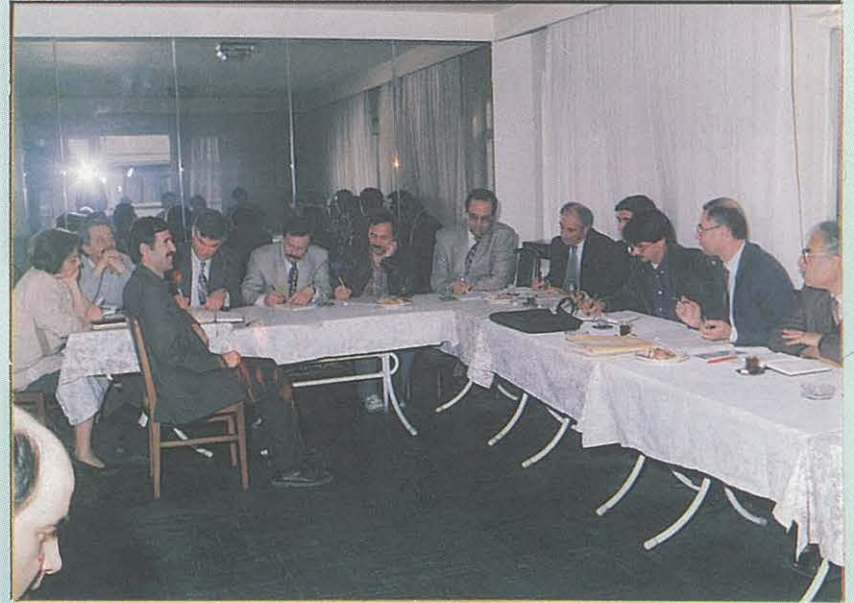
ODA Başkanımız ve Sulama Komisyonu Üyeleri Toplantıya Katılan Özel Sektör Temsilcileri ile Birlikte

O DA'mız, Sulama Yılı Etkinlikleri çerçevesinde, ilgili kamu ve özel sektör kuruluşlarının da katılımıyla 5-7 Haziran 1995 tarihlerinde DSİ Genel Müdürlüğü Toplantı Salonu'nda "SULAMA SEMPOZYUMU" düzenledi. Sempozyum süresince bir sergi de düzenlendiğinden, sergiye katılmak isteyen 20 büyük özel sektör ve PANKOBİRLİK temsilcileri ile 8.4.1995 Günü ODA'mız Genel Merkezi'nde bir toplantı yapıldı.