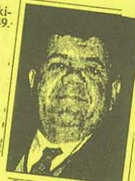
Prof. Çakır, yetkilerin bir mekan bir dekan ile de litle açılır mantığıyla inini savundu.