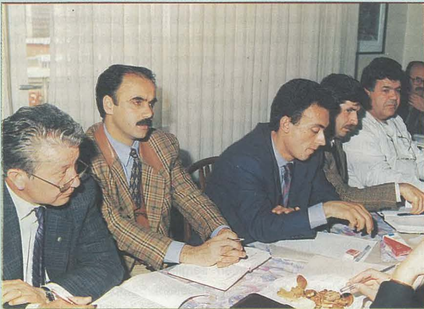
Samsun, Adana ve İzmir Şube Yöneticilerimiz