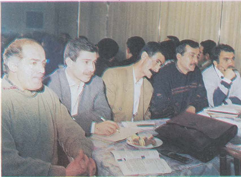
Bursa, Balıkesir, Diyarbakır ve Denizli Yönetim Kurulu Üyeleri