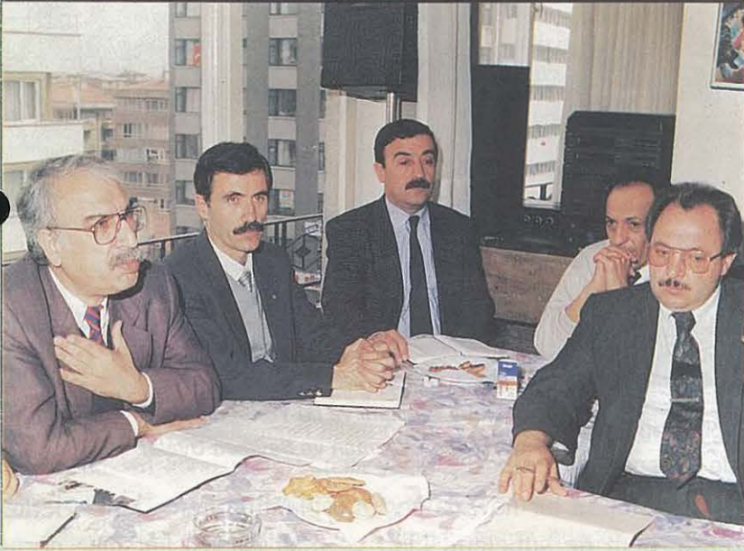
Genel Merkez Yönetim Kurulu Üyeleri ve Erzurum Şube Başkanı Toplantı Sırasında