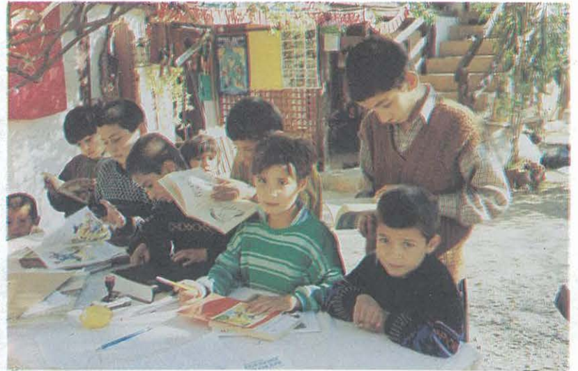
Okurevi'nde Geleceğin Aydınları Yetiştiriyor