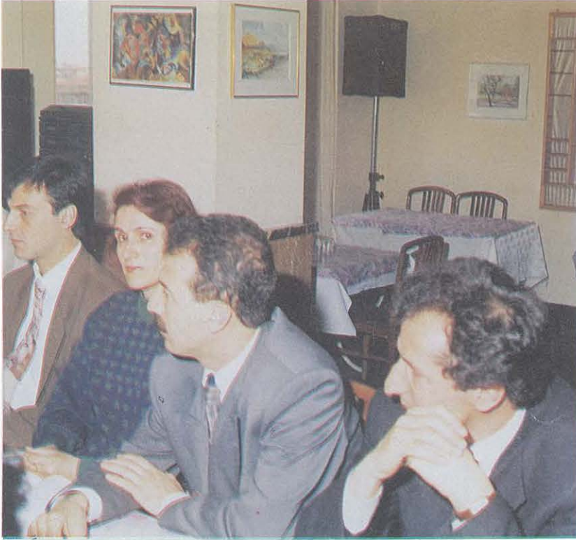
Rize, Diyarbakır ve İzmir Yönetim Kurulu Üyeleri Toplantı Sırasında