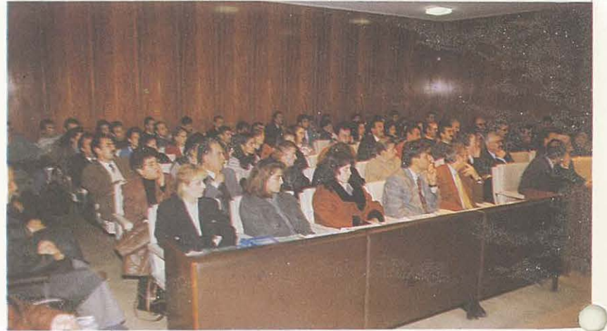
Özelleştirme ve Tarıma Etkileri Paneline Katılan İzleyiciler