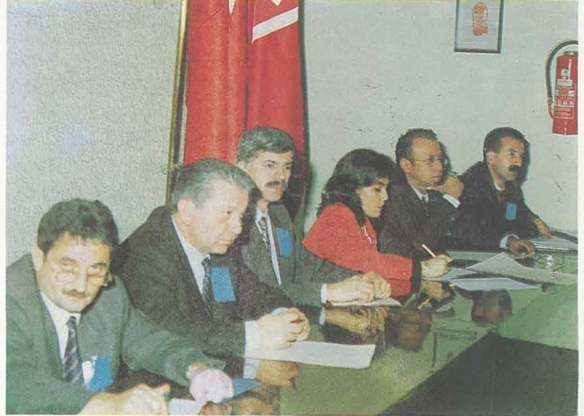
Olağanüstü Genel Kurul Başkan Yardımcıları ve Yazman Üyeler

Oda örgütünün demokratik ve ilkeli işleyişinin geliştirilmesine yönelik Tüzük değişikliklerini onaylayan örgütümüze şükran duygularımızı sunuyoruz. Tüzüğün oluşturulmuş yeni metninin TMMOB Tüzüğü gereği Birlik Yönetim Kurulunca görüşülmesinin ardından, Oda yayın organlarında meslektaşlarımızın bilgilerine sunulacağını duyuyoruz.