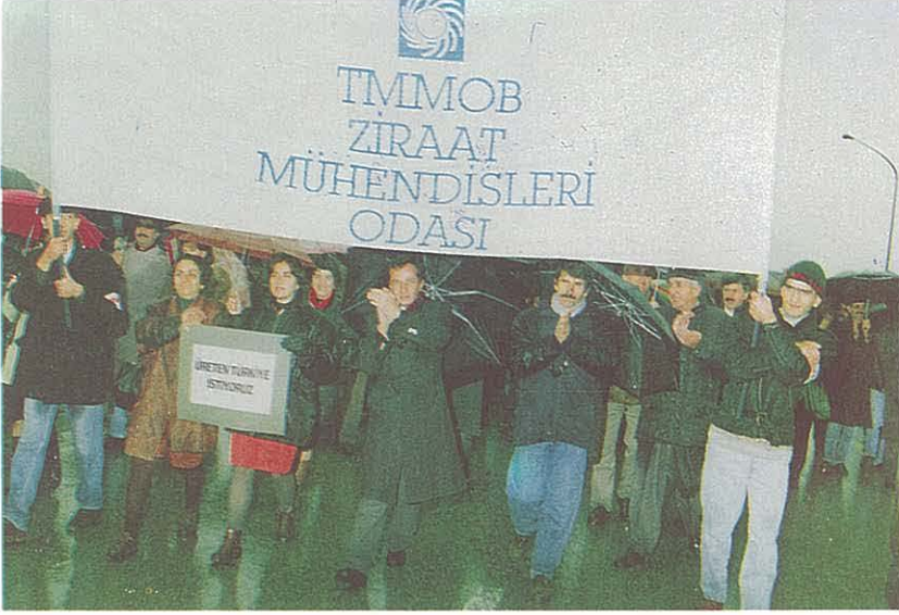
Yürüyüşten Bir Başka Görünüş

Miting öncesi ve sonrasında, TMMOB ve Odalardan oluşan çalışma grupları, siyasal ve yönetsel karar organları ve yetkilileriyle de bir dizi görüşme yaptılar. TBMM Başkanı Sayın Hüsameddin CİNDORUK, Başbakan Sayın Tansu ÇİLLER, Başbakan Yardımcısı Sayın Murat KARAYALÇIN, parlamentoda bulunan Mühendis - Mimar meslektaşlar ve Plan Bütçe Komisyonu Başkan ve üyeleriyle gerçekleştirilen görüşmelerde ülke kalkınmasında yaşamsal önemi ve sorumluluğu bulunan teknik elemanların karşı karşıya bırakıldıkları ekonomik zorlukların kesinlikle giderilmesi gerektiği, bu kitleyi ekonomik açmazla sürüklemeye kimsenin hakkı olmadığı ve sorunların giderilmesine kadar, demokratik mücadelenin kararlılıkla sürdürüleceği düşünceleri aktarıldı.