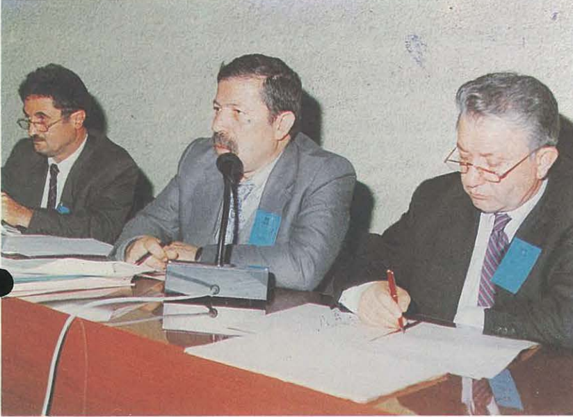
Olağanüstü Genel Kurul Başkan ve Yardımcıları

34. Olağan Genel Kurulda alınan karar uyarınca ve daha sonra gerçekleştirilen Danışma Kurullarında belirlenen doğrultularda Tüzük değişikliklerinin karara bağlanması öngörülen Olağanüstü Genel Kurul, 19 Kasım 1994 tarihinde toplanarak çalışmalarını tamamladı.