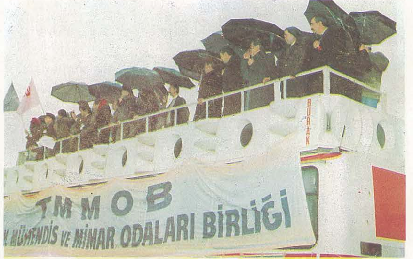
ODA Başkanımız ve Diğer Odaların Yöneticileri Konuşmanın Yapıldığı Alandaki Kürsüde

Önceki sayımızda da belirtildiği gibi, kamu kesiminde çalışan mühendis ve mimarların özlük hakları ve ücretlerine yönelik olarak, içlerinde ODA'mızın da bulunduğu altı ODA tarafından TMMOB platformuna yansıtılan mücadele programı, aşama aşama uygulamaya konuldu.