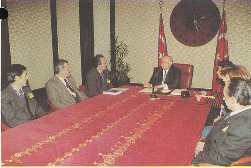
Yönetim Kurulumuz Sayın Cumhurbaşkanı ile Görüşmede

ODA Yönetim Kurulu Sayın Cumhurbaşkanı Süleyman DEMİREL ile, yılın ikinci görüşmesini yaptı.