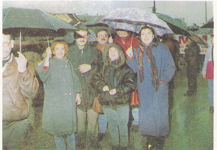
Ankara'dan ve Şubelerden Yürüyüşe Katılan Üyelerimiz

TMMOB ve Odaların bütünlüğünde gerçekleştirilen programın önemli bir aşamasını oluşturan "MÜHENDİS - MİMAR MİTINGİ ve YÜRÜYÜŞÜ" 19 Kasım 1994'de ANKARA'da gerçekleştirildi. ODA'mız üyesi çok geniş bir meslektaş kitlesinin de coşkuyla katıldığı yürüyüş ve miting, olumsuz hava koşullarına rağmen, görkemli, sorumlu ve örnek bir demokratik kitle eylemi olarak sonuçlandı.