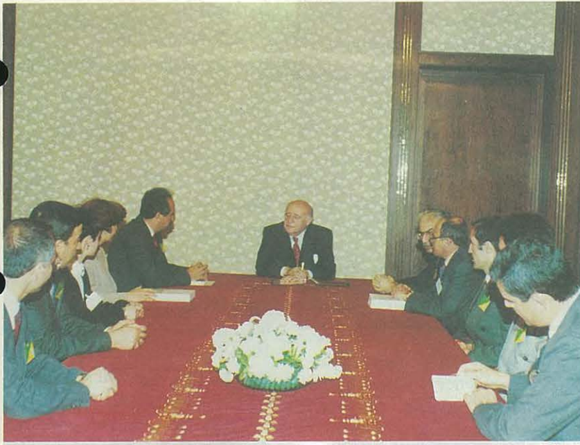
Yönetim Kurulu Sayın Cumhurbaşkanı ile Görüşmede

Yönetim Kurulu'muz tanışma ve yeni dönem çalışmaları hakkında bilgi sunma amacıyla, 22 Mart 1994 tarihinde Sayın Cumhurbaşkanı' nı ziyaret etti.