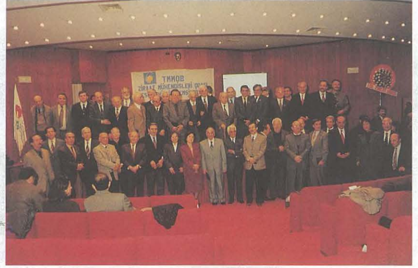
Eskişehirdeki Etkinlikte Plaket Alanlar Toplu Halde