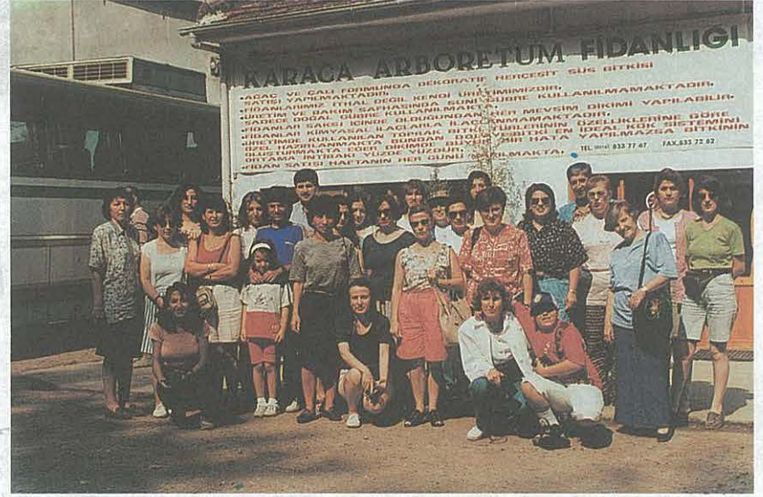
Yalova-Karaca Arboretum Gezisine Katılanlardan Bir Grup

Arboretumun yeri; Yalova-Samanlıköy'de Yalova'nın merkezine on dakika uzaklıktadır. 13.5 ha arazi üzerinde kurulu denizden 20 m. yükseklikte, Toprak çeşidi ise; Ağır-killi, yer-yer kumlu-killi, killi-balçık olmak üzere değişiyor. PH nötr'e yakın. Senelik 700-750 mm. yağışı mevcut. Enlem 40-37 Kuzey Enlemleri, Boylam 29-15° Doğu Boylamındadır. Bitki sayısı ise 7000 odunsu bitki ve 7000 otsu, soğanlı, rizomlu (Tür, Alttür, Varyete ve Kültür formu) olmak üzere 14.000 dir.