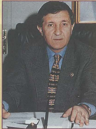
Doç.Dr. Metin Şahin Sanayi ve Ticaret Bakanı