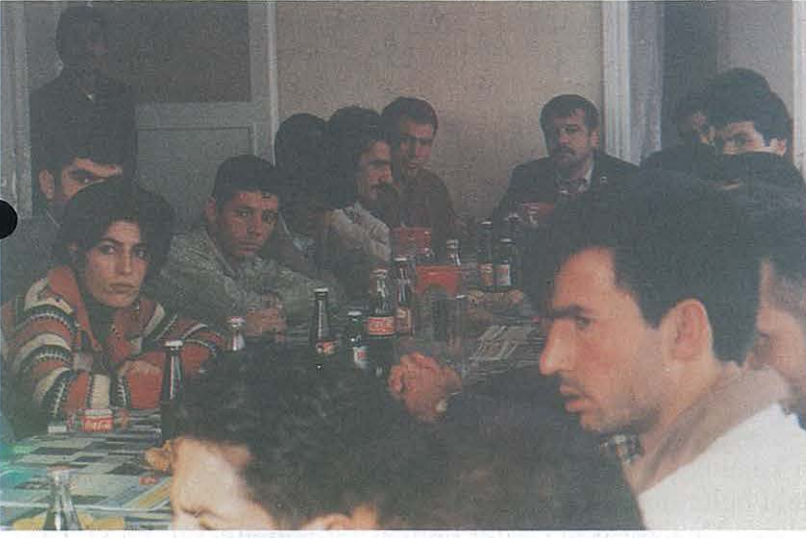
Şanlıurfa ZMO Lokalinde Ziraat Fakültesi Öğrencileri ile Yapılan Eğitim ve Sohbet Toplantıları

✓ Şanlıurfa Şubemiz, Harran Üniversitesi Ziraat Fakültesi son sınıf öğrencileriyle Oda'mız lokalinde toplantılar düzenlemiştir. Bu toplantılarda; Ziraat Mühendisleri Odası çalışma alanları, etkinlikleri ve görevleri konusunda bilgi alışverişi yapılarak öğrencilerimize Oda'mız tanıtılmıştır.