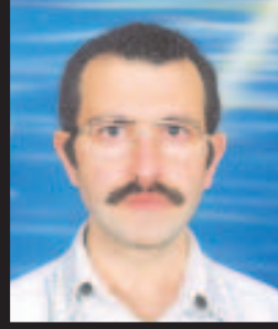
ALİ ARSLAN KORKMAZ

1936 Bornova doğumlu, 1963 yılı Ege Üniversitesi Ziraat Fakültesi mezunu Fikri EVCİL vefat etmiştir. EVCİL, 1965 yılında Bornova Zirai Mücadele Araştırma Enstitüsü'nde asistan olarak başladığı meslek yaşamını aynı kurumda emekli oluncaya dek sürdürdü. Merhuma Tanrı'dan rahmet; kederli ailesine ve tüm camiamıza sabır ve başsağlığı dileriz.