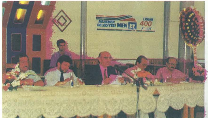
Menemen'de Düzenlenen "Tarım Arazilerinin Amaç Dışı Kullanımında Yerel Yönetimlerin Yeri ve Önemi" Paneline Katılan Panelistler

- 5.7.1995 tarihinde E.Ü. Ziraat Fakültesi, E.Ü. Bilgisayar Araştırma Uygulama Merkezi ve Şubemizce ortaklaşa düzenlenen "TARIMDA BİLGİSAYAR UYGULAMALARI SEMPOZYUMU" şubemizce kitap haline getirilerek yayınlanmıştır.