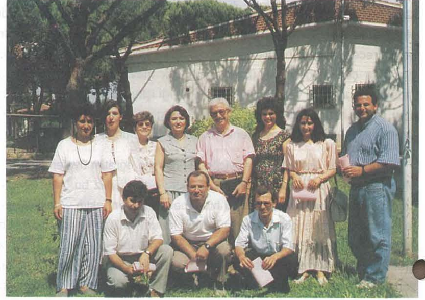
İngilizce Kursunu Başarıyla Tamamlayan Kursiyerler

Belediyeler İmar planları yapma, kentsel altyapı hizmetlerini götürme, çevre sağlığı, kaçak yapılaşmayı önleme gibi önemli görev, yetki ve