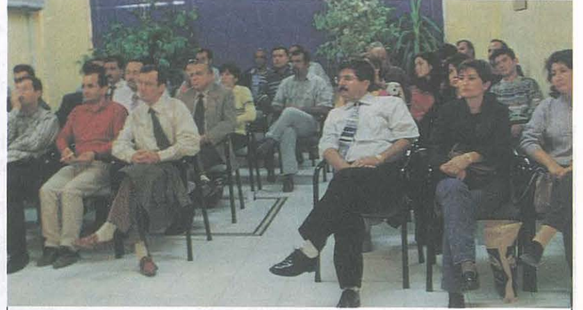
"Kesme Çiçek Üretiminin Dünü, Bugünü ve Yarını" Konferansı İzleyicileri