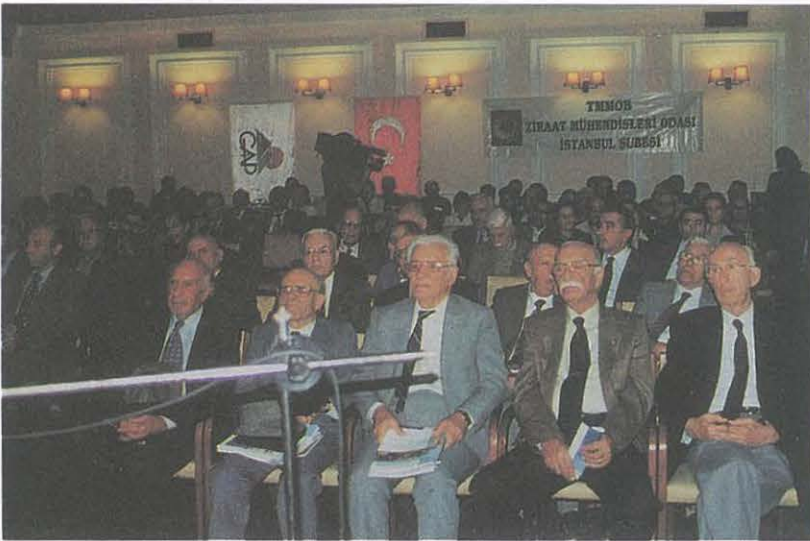
"Dünü, Bugünü ve Geleceği ile GAP" Konferansı İzleyicileri