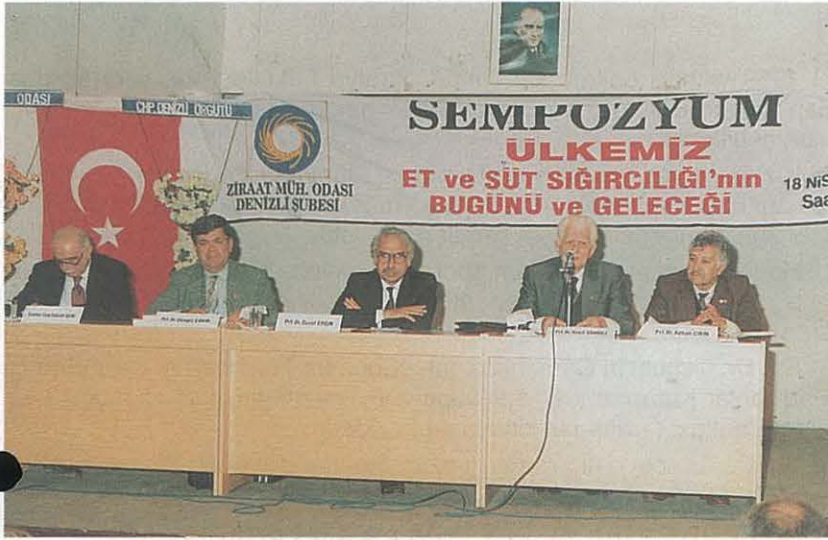
18 Nisan'96 Süt ve Et Sığircılığı Sempozyumuna Katılanlar: