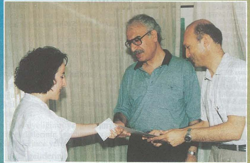
Proje Hazırlama ve Değerlendirme Kursu'nu Başarı ile Tamamlayan Bir Kursiyer Sertifikasını ODA Başkanımızdan Alırken

Bu yıl açtığımız kursu başarıyla bitiren 24 üyemize belge-ri törenle verildi. T.C. Ziraat Bankası Genel Müdürlüğü'ne ve kurs hocalarımıza mesleğimize yaptıkları iyi niyetli katkıdan dolayı teşekkür ediyor, sertifikalı mühendislerimize de başarılar diliyoruz.