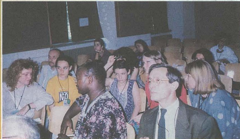
Panelimizi İzleyen Yabancı Katılımcılar