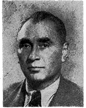
Zihni Derin 1880 — 1965