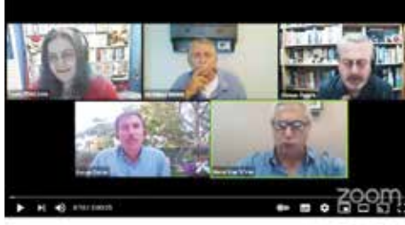
Tarım Neler Oluyor? - Online Panel

İmar Kanunu'nun 21. maddesinde düzenlenen "Yapı ruhsatı" ve 30. maddesinde düzenlenen "Yapı Kullanma İzin Belgesi" ne karşılık gelecek şekilde 6360 sayılı Kanun'da düzenlenen "ruhsatlandırılmış sayılma" biçiminde kanun çıkarıldı. Böylece tarımsal vasfı korunacak olan arazilerde mevcut