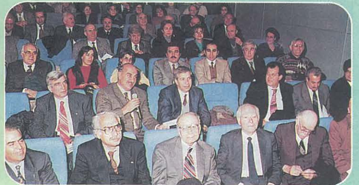
Konferanstan Bir Görünüm