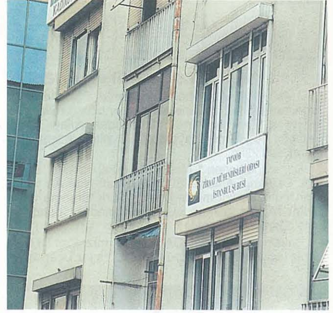
Istanbul Şubemizin Yeni Hizmet Binası

Istanbul Şube Yönetim Kurulu'nu bu çok önemli başarısından dolayı kutluyoruz ve yeni yerimizin İstanbul'daki tüm meslektaşlarımıza hayırlı olmasını diliyoruz.