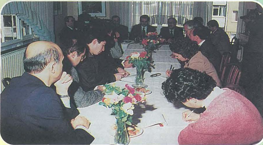
Bakanımızın ODA'mızı Ziyaretinden Bir Görünüm