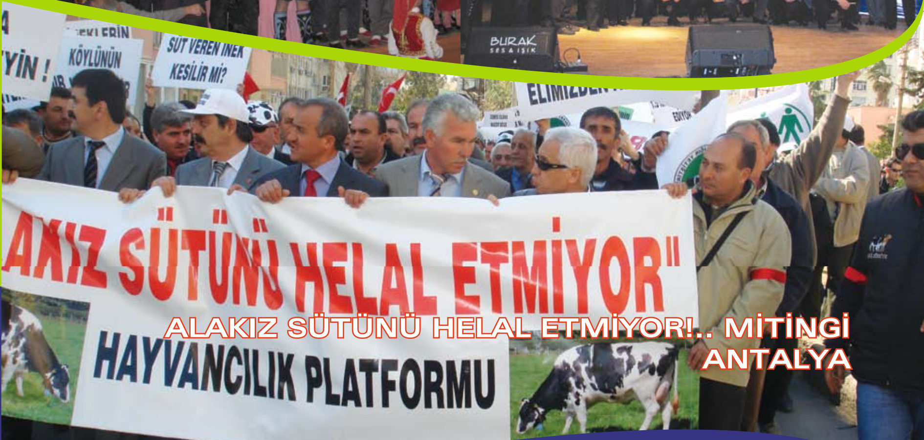
ALAKIZ SÜTÜNÜ HELAL ETMİYOR!.. MİTINGİ ANTALYA