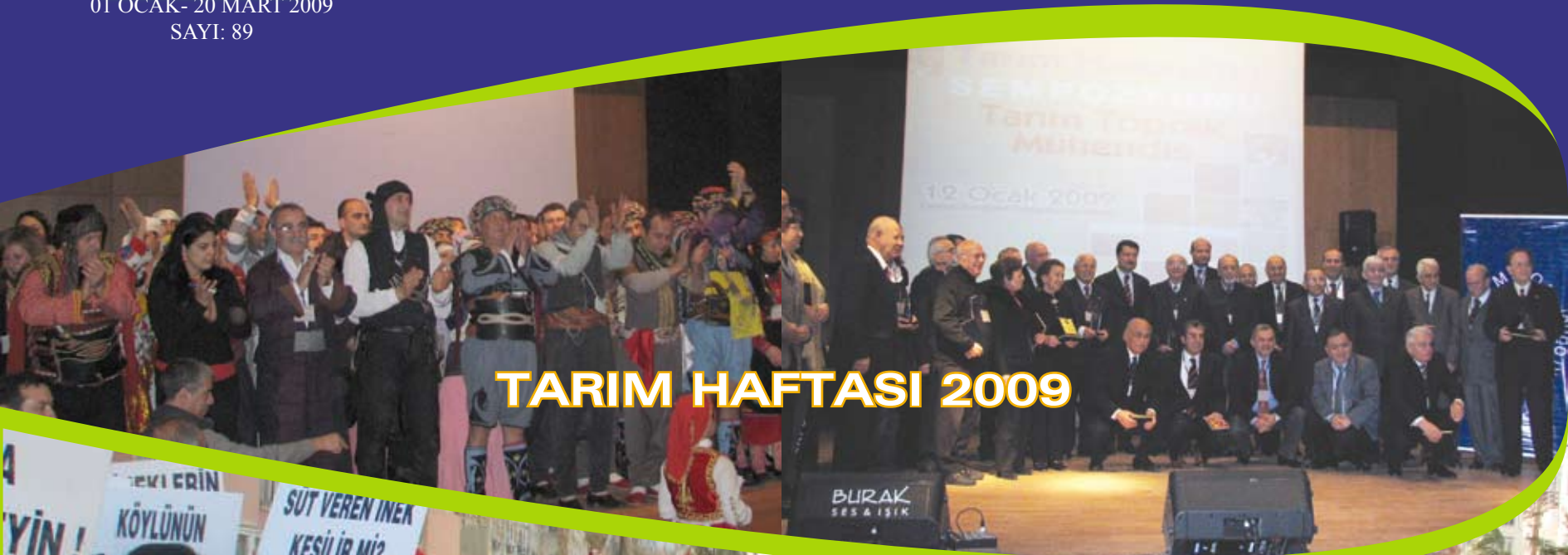
TARIM HAFTASI 2009