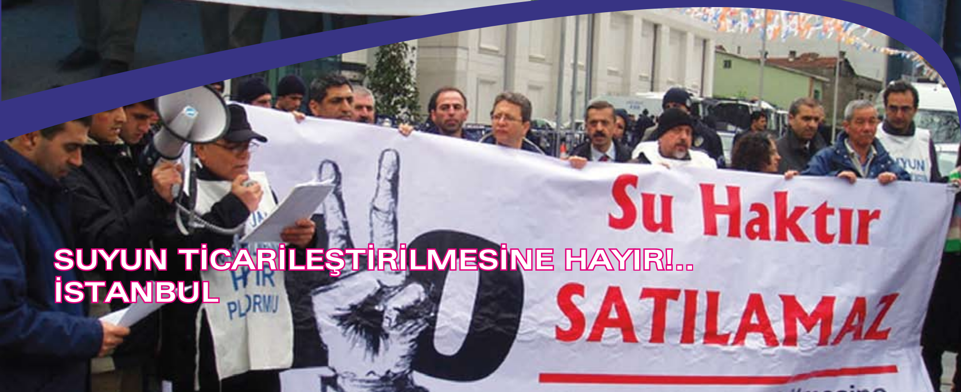
SUYUN TİCARİLEŞTİRİLMESİNE HAYIR!.. İSTANBUL